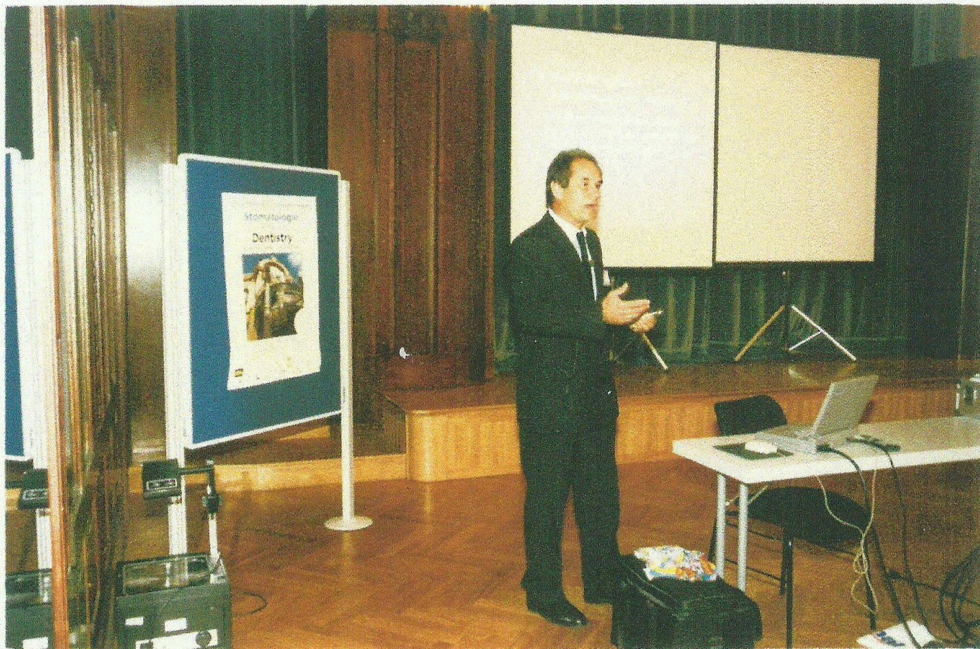
Pražské dentální dny 1997

Jeho zásluhy ocenila Česká stomatologická komora oficiálně již dvakrát. V roce 1997 obdržel poděkování za spolupráci při vzdělávání a výchově zubních lékařů a v roce 2001 poděkování zahraniční osobnosti.